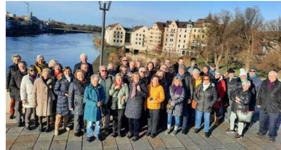
Teilnehmer auf der Steinernen Brücke

14.01.2023 Fahrt nach Regensburg zur Krippenausstellung