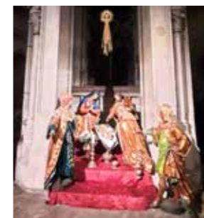
Krippe im Dom St. Peter