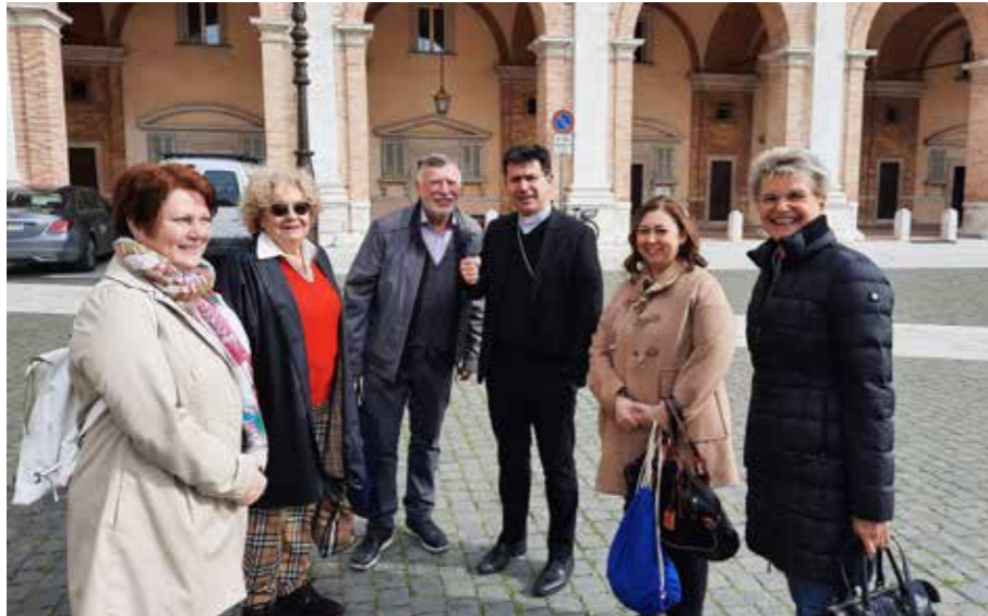
Treffen mit Bischof Fabio Dall'Aglio von Loreto (Bildmitte)